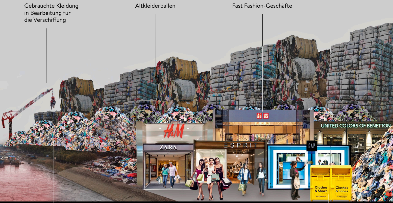
Gebrauchte Kleidung in Bearbeitung für die Verschiffung