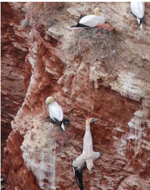
Abb.: Die an Plastikfäden verendeten Vögel hängen oft noch jahrelang in der Felswand.

Zusammen mit dem Verein Jordsand und dem Magazin GEO hat Greenpeace im Dezember 2015 deshalb ein Forschungsprojekt auf Helgoland gestartet und einen Teil der Nester am Lummenfelsen geborgen sowie einen anderen Teil von den Plastikschlingen befreit. Ziel ist es, herausfinden, wie viel und welches Plastik zum Nestbau genutzt wird, und ob das Vogelsterben so verringert werden könnte. 2