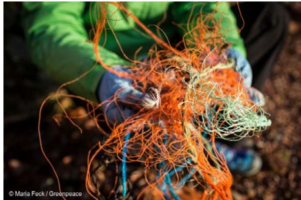
Abb.: Verhedderte Dolly Ropes – das reissfeste Gebilde wird zur tödlichen Falle für Vögel.