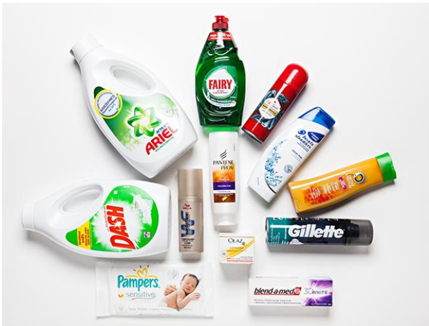
Abb. Eine Auswahl von den zahlreichen Produkten des P&G-Konzerns, die Palmöl enthalten.

Der Erfolg der bisherigen Verpflichtungen der Palmölindustrie hängt auch davon ab, ob Palmölabnehmer wie Procter & Gamble deren Umsetzung einfordern und sich selbst zu einer Lieferkette, die frei von Regenwaldzerstörung ist, verpflichten. Dazu gehört die Entwicklung einer Richtlinie für den Bezug von Palmöl, die strenge