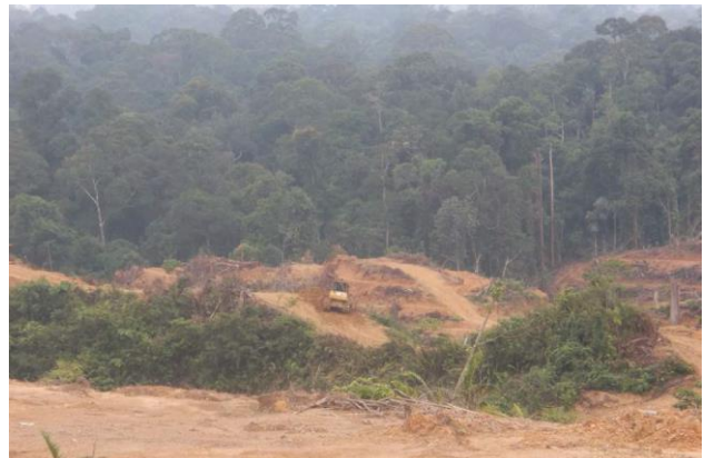
Auf der Musim Mas-Konzession PT MPG (Zentral-Kalimantan) wird Wald gerodet. (8.2.14; 00°45' 45.42" S 114°41' 23.93" E)

Auch in der Konzession PT Multipersada Gatramegah (PT MPG) in Zentral-Kalimantan hat Greenpeace durch Satelliten-Auswertungen nachgewiesen, dass die Firma Wald gerodet hat, darunter Gebiete, die als Orang-Utan-Lebensraum kartiert wurden.