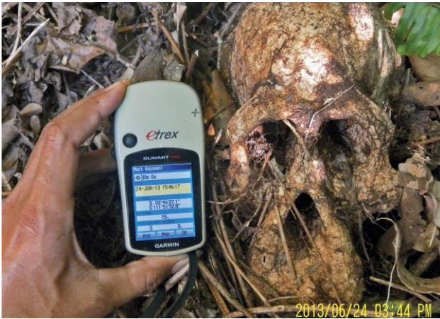
Abb: Die Überreste eines Orang-Utans in der Nähe der Palmölplantage von PT Bumi Langgeng Perdanatrada, die zu BW Plantation gehört. Gefunden nahe des Tanjung Puting National Park in Zentral-Kalimantan (24.6.13 02°46'28.8"S 111°50'30.7"E).

Kalimantan. Unmittelbar an der Grenze zur Plantage wurden mehrere Orang-Utan-Skelette gefunden. Lokale Gruppen berichten, dass die Orang-Utans nicht eines natürlichen Todes starben, sondern getötet wurden.