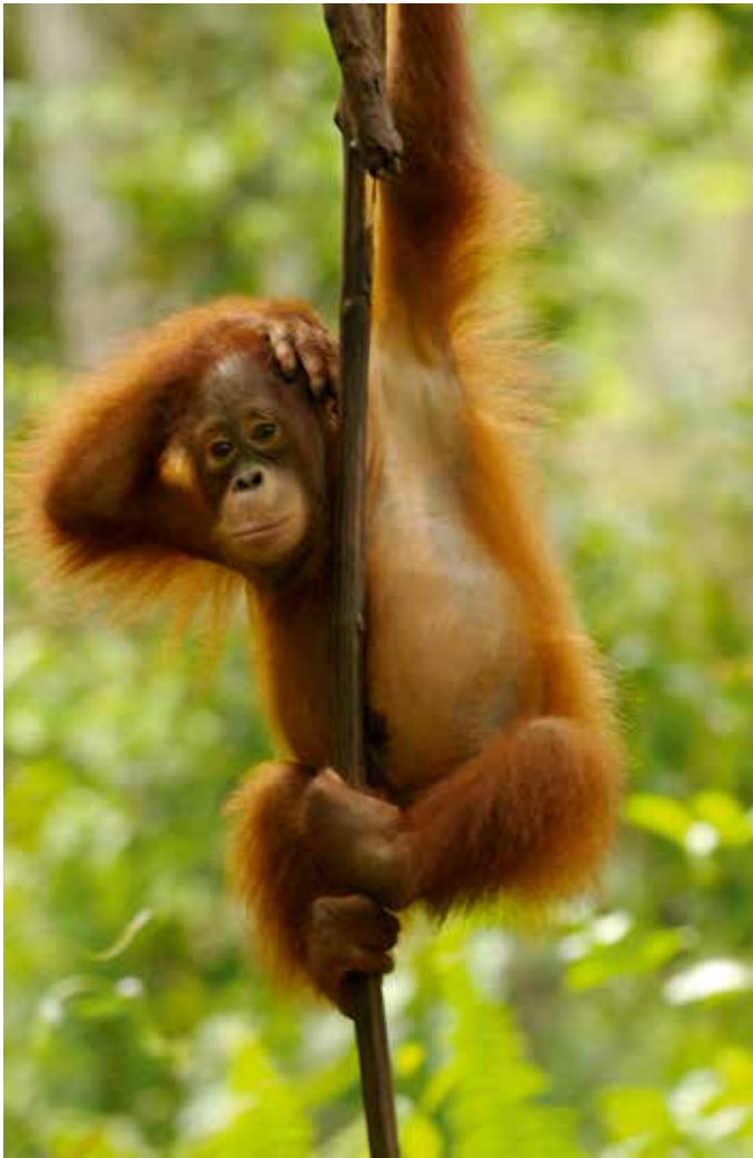
Sterben die Urwälder, sterben seine Bewohner: In den asiatischen Regenwäldern leben nur noch sehr wenige Orang-Utans.