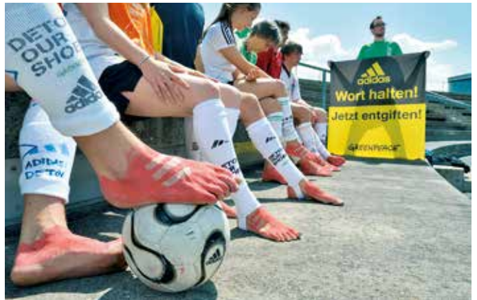
Kurz vor der Fußball-WM: Greenpeace protestiert weltweit gegen zu viel Gift in Adidas-Fußballschuhen.