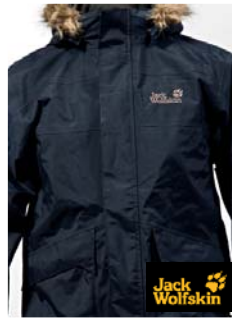
Jack Wolfskin Nebraska Parka Kinderjacke (D)