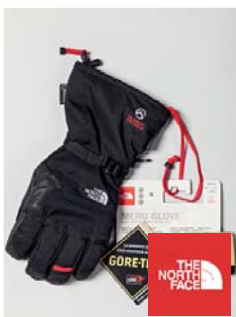
The North Face Meru Glove Handschuhe (USA)