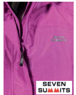
Seven Summits Monte Viso Jacke (A)