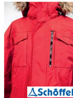
Schöffel Keaton Jacke (D)