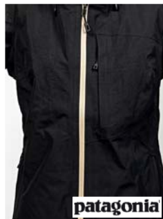
Patagonia W'S Powder Bowl JKT Jacke (USA)