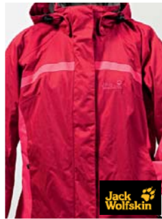
Jack Wolfskin Topaz Jacket Women Jacke (China)