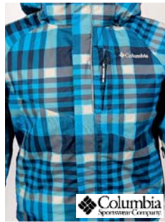
Columbia Evo Fly Jacket Kinderjacke (D)