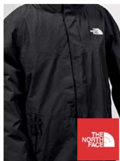
The North Face All Terrain II Jacke (D)