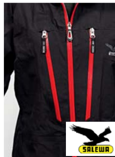
Salewa Kali GTX M JKT Jacke (D)