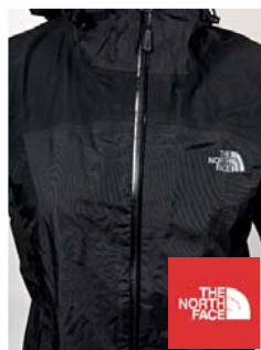
The North Face W Impervious Jacket Jacke (USA)