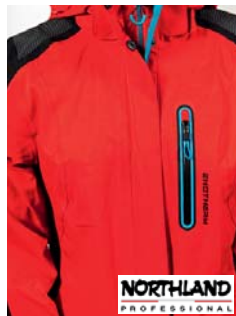
Northland EXO Pro STR Monie JKT Jacke (A)