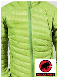
Mammut Miva Light Jacket Women, Jacke (CH)