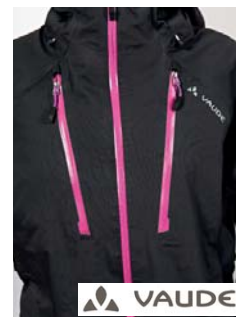
Vaude Cheilon Stretch Jacket 2 Jacke (D)