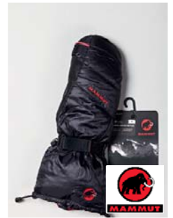
Mammut Extreme Arctic Mitten Handschuhe (CH)