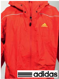
Adidas TX GTX ActS j Jacke (D)