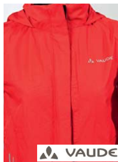
Vaude Regenjacke Kids Kinderjacke (D)