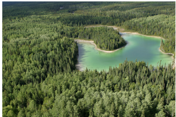
Der Boreale Wald speichert große Mengen Kohlenstoff. Seine Zerstörung heizt den Klimawandel weiter an.

ringert auch seine Fähigkeit Kohlenstoff aus der Luft zu binden, denn die jungen nachwachsenden Bäume haben für viele Jahre nicht die Aufnahmekapazität eines natürlich gealterten Urwaldes. Dies ist aber ein entscheidender Faktor, um den Klimawandel aufzuhalten, da die Konzentration der Treibhausgase in der Erdatmosphäre der kommenden zehn Jahre über den weiteren Verlauf des Klimawandels entscheiden wird.