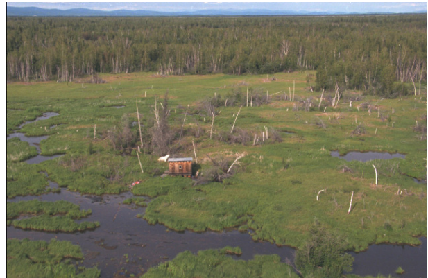
Das Auftauen der Permafrostboden im Borealen Wald entscheidet über den Verlauf des Klimawandels.

Mit steigenden Temperaturen wird eine Wanderung der Arten nordwärts in kühlere Gebiete erwartet. Doch die Wanderung von Tieren und Pflanzen wird nicht mit der gleichen Geschwindigkeit stattfinden.