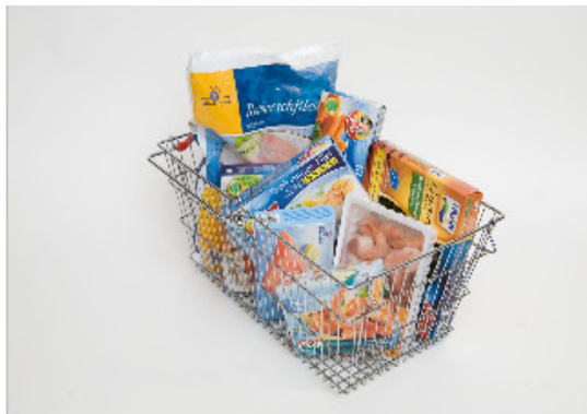
Abbildung 1: Fischprodukte aus dem Supermarkt

In Deutschland liegt der Pro-Kopf-Verbrauch an Fisch mittlerweile bei jährlich