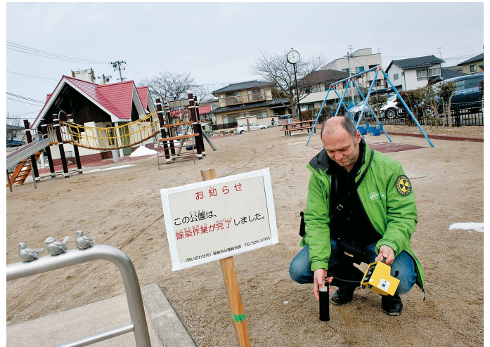
Seit dem Unfall untersuchen Greenpeace-Experten etwa zweimal im Jahr die Strahlenwerte verschiedener Regionen und sprechen mit ehemaligen Bewohnern der verseuchten Gebiete.

tische Folgen für die Gesundheit der Bevölkerung sind abzusehen. Doch die japanische Regierung verharmlost: Im Oktober 2015 bestätigte das japanische Gesundheitsministerium offiziell den ersten Leukämiefall eines Arbeiters in der havarierten Atomanlage, der in direktem Zusammenhang mit dem Unglück steht.