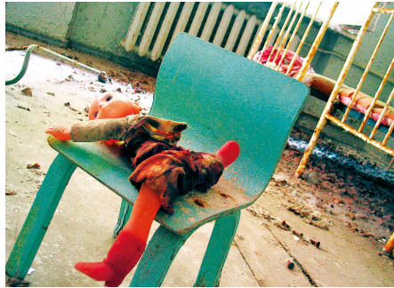
Hals über Kopf mussten 48.000 Einwohner Pripyat im April 1986 verlassen. Bis heute ist die Stadt Sperrgebiet.

Es ist fast ein Drittel Jahrhundert her, dass der erste Super-GAU in der zivilen Atomnutzung das Vertrauen in diese Technik zu radioaktivem Staub zerfallen lässt: Am 26. April 1986 gerät im Block 4 des ukrainischen Atomkraftwerks Tschernobyl ein Test außer Kontrolle, die nukleare Kettenreaktion lässt sich nicht mehr stoppen.