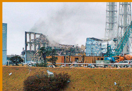
Block 3 des Atomkraftwerks Fukushima Daiichi nach der Explosion