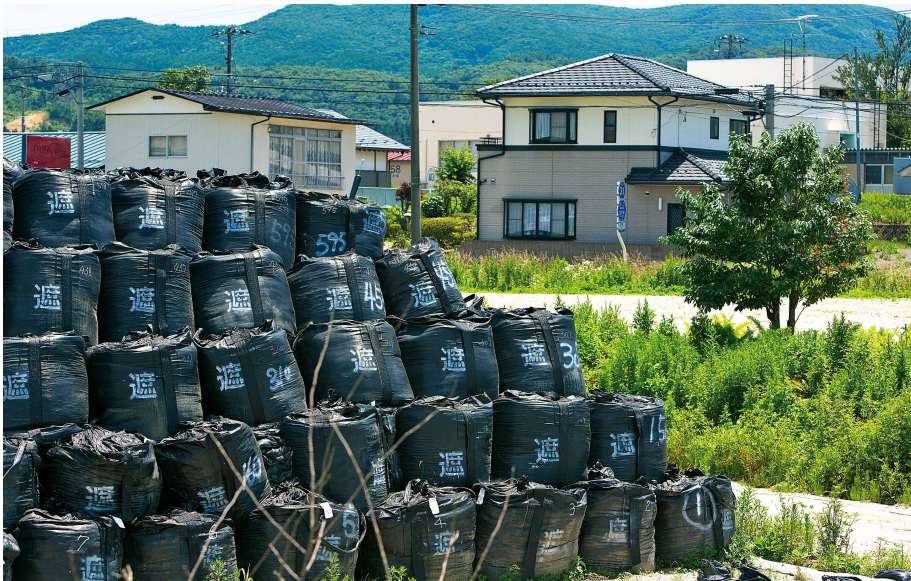
Beim aberwitzigen Versuch, eine ganze Region von der Strahlung zu säubern, sind 9 Millionen Kubikmeter Atom Müll angefallen. In Plastiksäcken verpackt lagert er überall am Wegrand. Doch die Region ist immer noch radioaktiv verseucht.

wohnbar sind. Doch die Fakten sprechen eine andere Sprache.