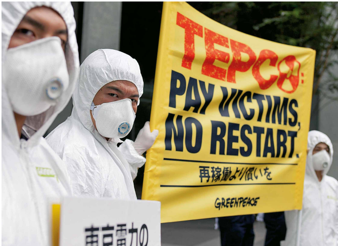
„Entschädigt die Opfer, statt Atomkraftwerke wieder anzufahren“, fordert Greenpeace von der Betreiberfirma Tepco 2015 bei einer Aktion gegen den Neustart japanischer AKWs.