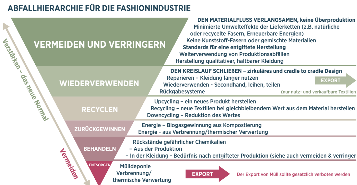
Abbildung 2 → Abfallhierarchie für die Fashionindustrie