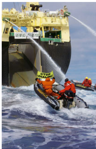
Anti-Walfang-Aktion, 2006 „Wir brauchen auch Bilder“