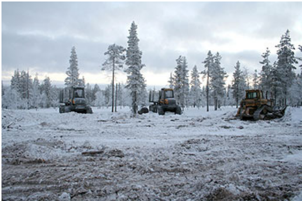
Urwaldzerstörung in Lappland.

Die finnischen Wälder sind von großer Bedeutung für ein Netzwerk von Schutzgebieten in Nordeuropa. Sie dienen als Brücken zwischen anderen Urwäldern in einer Region, in der bereits viele Wälder zerstört wurden. Sie beherbergen viele bedrohte und gefährdete Arten und dienen ansässigen Rentierhaltern als Weideflächen für Ihre Tiere.