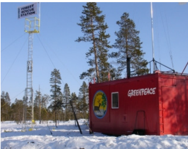
Im März 2005 protestiert Greenpeace mit einer Urwaldschutzstation in Lappland gegen die Urwaldvernichtung in Finnland.