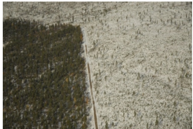
Per Luftbild wird der Kahlschlag im Kessi-Urwald an der finnisch-russischen Grenze in Nordlappland deutlich sichtbar.

Die Kapazitäten der finnischen Papierindustrie sind trotz der jüngsten Werkschließungen noch sehr hoch und kommen ohne Rohstoffimporte nicht aus. Vor allem aus Südamerika wird Zellstoff importiert.