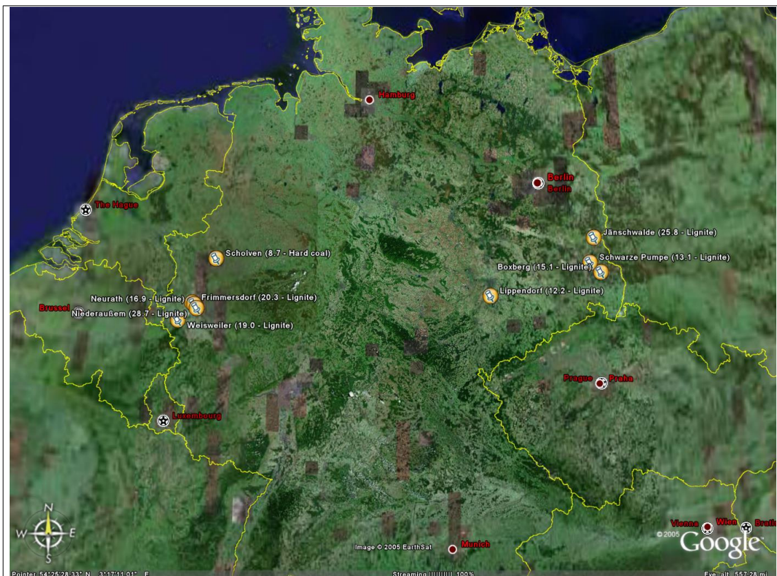
Abbildung 2 Fossile Kraftwerke in Deutschland mit mehr als 7 Mio. t CO 2 -Emissionen

In Abbildung 2 sind die fossilen Kraftwerke in Deutschland mit mehr als 7 Mio. t CO 2 -Emissionen abgebildet. Der Wert hinter dem Standortnamen gibt die Menge der Emissionsrechte an, die der Anlage für den Zeitraum 2005-2007 zugeteilt wurden.