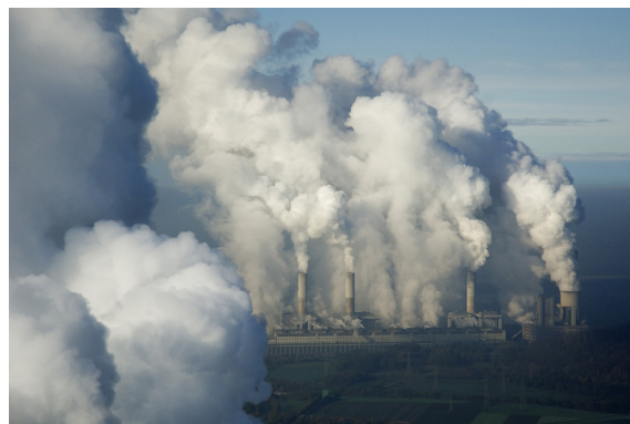
So ähnlich könnte es in Hamburg-Moorburg ab 2012 aussehen.

Vattenfall kann somit vor der möglichen Bildung einer neuen Bürgerschaft weitere Fakten für den Bau des strittigen Kohlekraftwerkes schaffen.