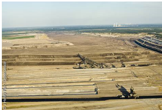
Braunkohletagebau in der Lausitz

Seen hat in vielen Fällen einen pH-Wert unter 3 und ist damit ähnlich sauer wie Essig oder Zitronensaft. Kein Fisch kann darin überleben, kein Mensch darin baden.