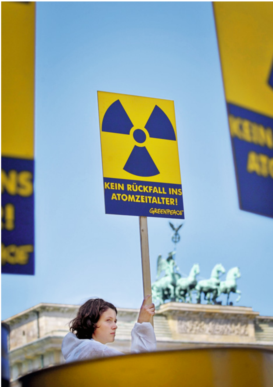
Eine Aktivistin am Brandenburger Tor in Berlin. Greenpeace protestiert während einer CDU/CSU-Tagung im Juli 2005 gegen die Pro-Atompolitik der Partei.